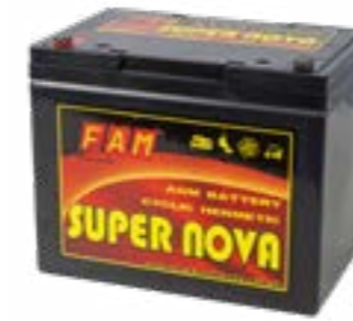
LIFEPO BATTERY E - 14